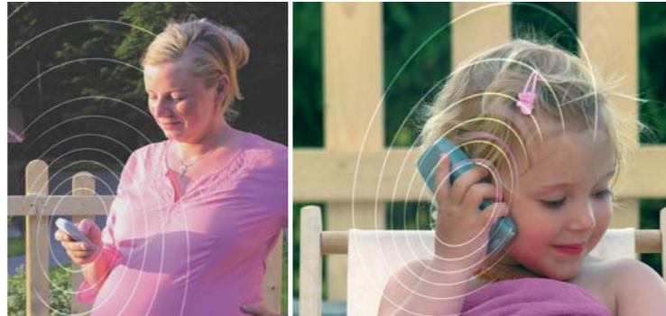
Il telefonino non è un giocattolo, ma una fonte di radiazioni

Un telefono cellulare acceso (anche in stand-by) emette periodicamente impulsi magnetici ed elettromagnetici. Durante una telefonata o l'invio di SMS si aggiungono le radiazioni elettromagnetiche pulsate necessarie alla comunicazione. È soprattutto nei confronti dei feti ancora nel ventre materno, dei lattanti e dei bambini in generale che queste radiazioni risultano provocare tutta una serie di effetti biologici importanti, in particolare nell'ambito neurologico. Se ne dovrebbe tenere conto evitando il più possibile l'esposizione dei piccoli alle fonti di irraggiamento.