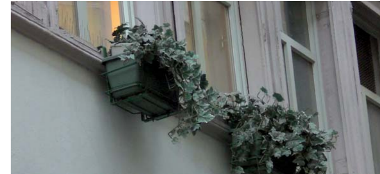
Microcella nascosta tra fiori in plastica, sulla facciata di un palazzo dei Portici di Bolzano